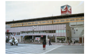
1990年の小岩駅南口の様子