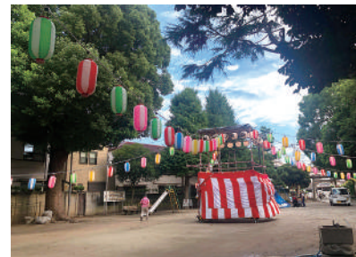
天祖神社のお祭り

KOITTOは、小岩に暮らす人、小岩を訪れる人、地域の団体など、小岩に関わる様々な人々の良好な繋がりを育み、協力連携を促進することを目的に、垣根を超えて様々なことにチャレンジしていきます。オール小岩での100年栄えるまちづくり。みなさんと共に歩んでいます。