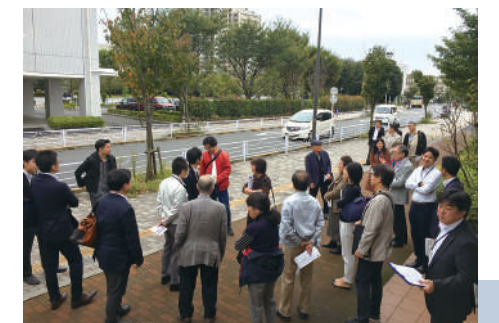
まちづくり協議会 先行事例視察の様子