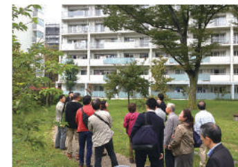
まちづくり協議会 先行事例視察の様子