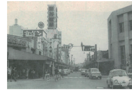
昭和40年ごろフラワーロード商店街入り口