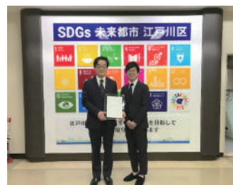
江戸川区内初の都市再生推進法人に指定されました。今後、公共的空間を利用したイベントなどで小岩のまちを盛り上げていきます。